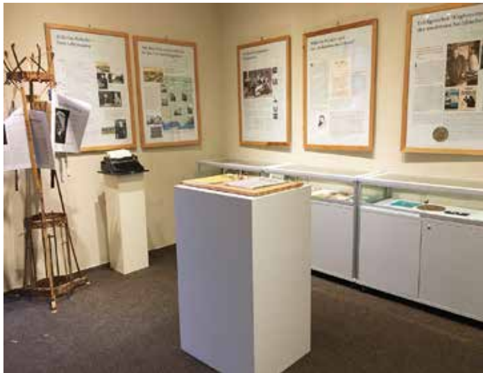
Ausstellungsraum des Dichterkreis-Museums

Mitglied des Kulturhistorischen Verein Friedrichshagen e.V.