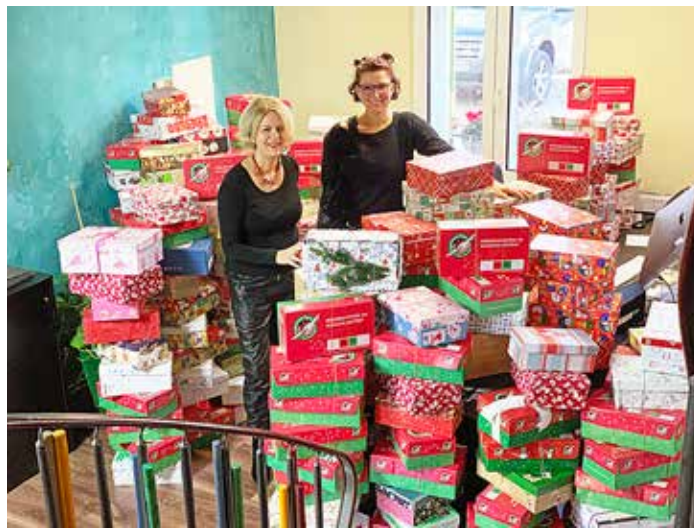
Das letzte Jahr war ein toller Erfolg. Seien Sie dieses Jahr bei der Aktion dabei: Bei der größten Geschenkaktion für Kinder in Not – Weihnachten im Schuhkarton.

Wir – ANKE HEIDT LebensWert IMMOBILIEN – beteiligen uns jedes Jahr an dieser Aktion. Als größte Annahmestelle in Berlin-Köpenick konnten wir im letzten Jahr 384 Pakete auf die Reise schicken. Wenn Sie Kindern mit liebevoll gepackten Geschenkkartons eine Freude machen wollen, bringen Sie diese bitte bis zum 13. November bei uns im Laden in der Bölschestraße vorbei. Sie können sich bei uns vorab auch leere, weihnachtlich dekorierte Kartons abholen. Dass wir diese dekorierten (Schuh-)Kar-