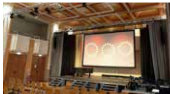
Viele Ehemalige werden sie so nicht kennen: Die 2021 neugestaltete Aula der GHS.

Gerhart-Hauptmann-Gymnasium – klingt das vertraut und weckt Erinnerungen? Zum ersten Mal öffnet das GHS für alle Ehemaligen seine Türen. Ehemalige Schüler:innen aller Jahrgänge sind ebenso eingeladen wie ehemalige Lehrkräfte.