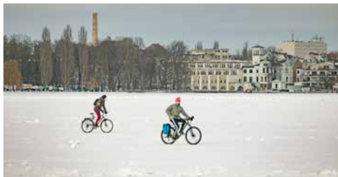
Im Februar 2021 konnte man eine Radtour auf dem Müggelsee machen.

Berichte über Massenentwicklungen von Algen kennt man aus dem Sommer. Im Winter sind die Algenmengen durch geringes Lichtangebot und niedrige Temperaturen meist gering. Gelegentlich wachsen einige Algen