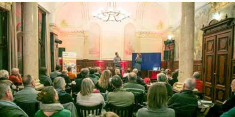
Gut gefüllt, aber es war noch Platz: Das Ortsteilgespräch des AMF im Ratsaal bot wieder Einblicke und Gesprächsmöglichkeiten zu verschiedensten Entwicklungen in unserem Kiez.