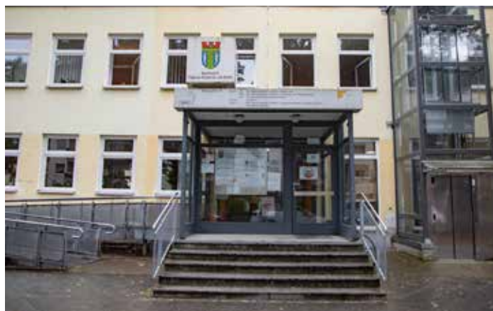
Regelmäßiger Treffpunkt der Ortsgruppe Friedrichshagen der Volkssolidarität und traditioneller Ort für die alljährliche Weihnachtsfeier:

Für alle unserer Mitglieder der Volkssolidarität, Gruppe 92 in Friedrichshagen, ist der Monat Dezember ein besonderer Monat. Es ist der Monat mit vielen Höhepunkten und Aktivitäten des Vorstandes und ihrer Mitglieder. Neben dem Abschluss unserer Spendenaktion zur vielfältigen Unterstützung unserer Seniorinnen und Senioren, für die wir uns bei allen Spendern nochmals sehr herzlich bedanken, gestaltete sich unsere erste Maßnahme zu einem für alle Teilnehmer:innen erlebnisreichen Tag. Mit dem voll besetzten Bus fuhren wir nach Haage, einem kleinen Ort im Havelland, zum Gänsebratenessen. Wir fanden einen sehr schönen, festlich dekorierten Saal vor. Die Wirtsleute und ihre Mitarbeiter:innen des „Deutschen Hauses“ hatten sich sehr viel Mühe gemacht. Das Essen war sehr gut organisiert, es gab keinerlei Gedränge, jeder hatte vorher einen Tisch mit seinen Freunden oder Bekannten zugewiesen bekommen. Das Personal hat durch seine Aufmerksam- und Freundlichkeit sehr viel Lob verdient. Das Essen selbst war in allen Belangen vorzüglich. Hatten wir in den vorhergehenden Jahren auch schon sehr gute Essen in anderen Gaststätten serviert bekommen, so übertraf es in diesem Jahr alle Erwartungen. Neben der sehr guten Qualität der