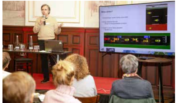
Das TELRAAM-Projekt zählt die Verkehrsströme im Kiez. Ein Mitarbeiter des Instituts für Verkehrsforschung am Deutschen Zentrum für Luft- und Raumfahrt erläuterte die Technik und die bisherigen Ergebnisse.

Ausführlich wurde auch das Telraam-Projekt dem Publikum vorgestellt (s. Friedrichshagen KONKRET 4/2023). Hierbei sind im ganzen Kiez