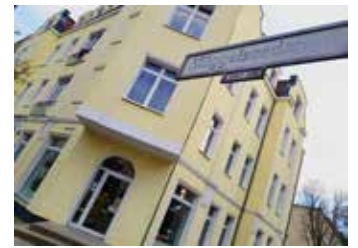
Nicht mehr das NBZ, aber noch immer gibt es viele Angebote am neuen Standort.

Wie gewohnt findet Ihr die Euch bekannten Ansprechpersonen und Projekte auch an dieser neuen Adresse: Anlaufstelle für Alleiner-