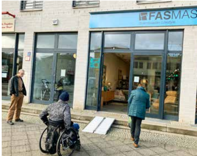
Ehrenamtliche Mitglieder des Arbeitskreis Mobilität Friedrichshagen setzen sich für barrierefreie Zugänge zu den Geschäften der Bölsche ein und stellen dafür den Inhabern mobile Rampen vor.

Im AMF hatte sich 2019 eine Projektgruppe gebildet, bestehend aus vier Personen, zwei davon mit Mobilitätseinschränkungen. Diese haben in den nächsten Monaten alle Gebäude in der Bölschestraße besucht und analysiert, ob sie für Kunden, Patienten und Personen mit anderen Anliegen barrierefrei erreichbar sind. Dies traf auf etwas mehr als 40 Objekte (dieser Begriff wird nun im Folgenden vereinfachend für alle Objekte verwendet) zu; 55 der 195 Objekte haben ein bis zwei Stufen und können mit mobilen Rampen erreicht werden. In mehreren Stufen wurde im AMF geprüft, welche Möglichkeiten es