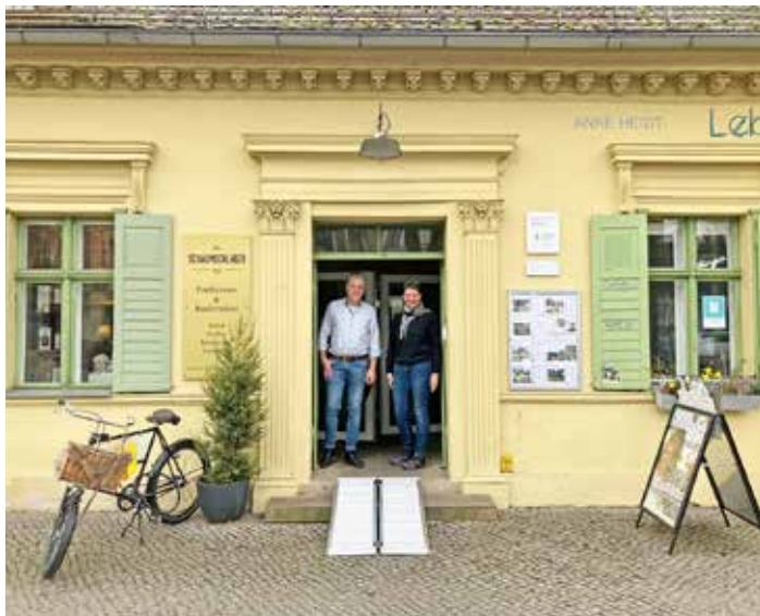
Gerade mal um die 120 Euro kostet es, eine Rampe anzuschaffen und damit vielen mobilitätsbeeinträchtigten Menschen den Zugang zu Geschäften zu erleichtern.

Der Bürgerverein und die Projektgruppe des AMF freuen sich über das Interesse aller derjenigen, die den Zugang zu ihren Geschäften der Bölschestraße barrierefrei machen möchten. Selbstverständlich kommen wir gern vorbei mit den Vorführexemplaren an Rampen. Melden Sie sich gern entweder bei