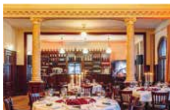
Alter Ratssaal: 30–120 Personen