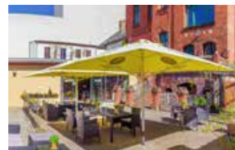
Willkommen auch in unserem Hof