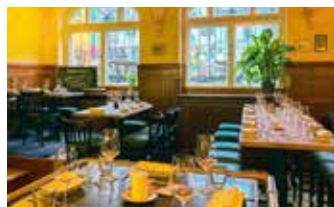
Ratskeller: Deutsche Küche, 20–60 Personen (Mi./Do. 17–23 Uhr, Fr./Sa. 17–24 Uhr) Hoftheke & Rathaus Hof: 10–30 Pers. im Innenbereich, 10–50 Pers. im Außenbereich