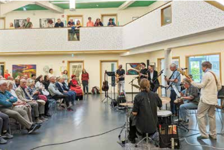
Letztes Jahr im Rathaus, dieses Jahr auf dem Grätzhof: die Keller Bluesband aus Schöneiche

Viele helfende Hände machen es möglich – so auch die freiwillige Feuerwehr Schöneiche